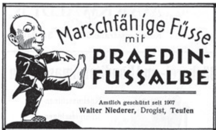
Inserat aus der Broschüre «5. Kant. Appenzellische Ausstellung, Teufen»

ein Kreisschreiben folgenden Inhalts ergehen: «Vereinzelte vermag der Handwerker nichts. Darum wirkt in Euerem Kreise für die Kräftigung der Sektionen, mahnet uns Fernstehende zum Anschluss und damit zum Beitritt in den Kantonalverband, damit dieser seine Stellung beibehalte im Kreise des Schweizerischen Gewerbeverbandes.» Vielleicht hätte bei wankelmütigen Mitgliedern ein ähnliches Schreiben auch in der Zeit der beginnenden Hochkonjunktur aufrüttelnde Wirkung gehabt.