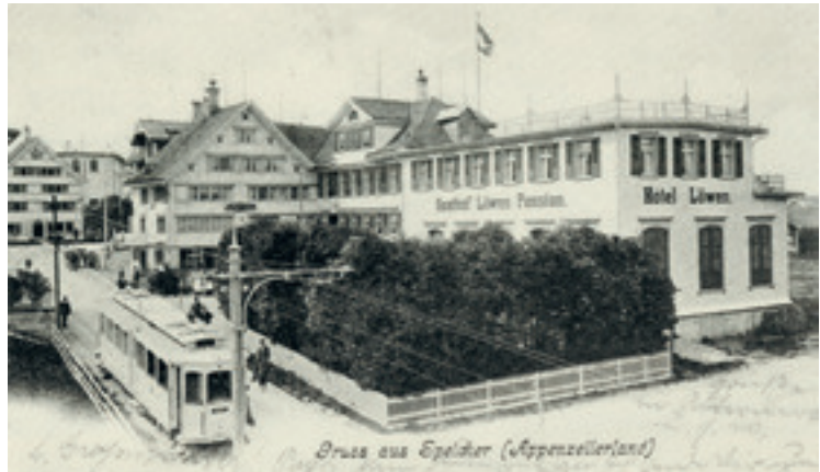
Hotel und Pension Löwen (heute «Appenzellerhof»), Speicher um 1900

in den Vorstand des Kantonalverbandes mündete und ihm fünf Jahre später das Präsidium eintrug.