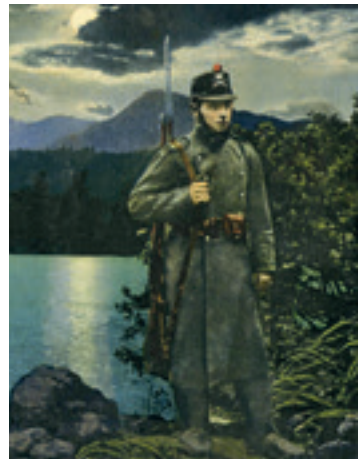
Eine Postkarte aus dem Zweiten Weltkrieg

Die Krise machte auch vor der Schweiz nicht Halt und schlug logischerweise auf die Regionen durch. So blieb denn auch das appenzellische Gewerbe nicht verschont. Die vom Schweizerischen Gewerbeverband 1935 erhobenen Zahlen über den Wirtschaftsgang können zwar nicht eins zu eins auch auf Ausserrhoden übertragen werden, vermitteln aber doch ein Bild von der prekären Situation. Danach waren beispielsweise fast fünfzig Prozent der Bauarbeiter arbeitslos. Und zwei Drittel der Gastwirtschaften in der Schweiz erwirtschafteten zu wenig Ertrag, als dass sie das Betriebskapital hätten verzinsen können. Eine 1936 erfolgte Abwertung des Schweizer Frankens um dreissig Prozent brachte für das Gastgewerbe und für die Exportindustrie wohl eine leicht Entspannung, nicht aber für die übrigen Branchen und namentlich für das Baugewerbe.