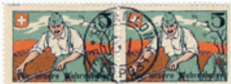
Soldatenmarke im Ersten Weltkrieg

mit Landammann Tobler an der Spitze, die «einen warmen Appell zu treuem und solidarischem Zusammenstehen und gegenseitiger Aus-hilfe in dieser schweren Zeit» erlassen habe. Der Appell richtete sich an die kantonalen Vorstände der Krankenvereine, der landwirtschaftlichen Vereine sowie der Handwerker- und Gewerbevereine und rechte mit