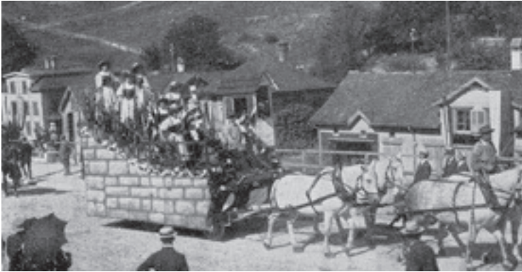
Winzergruppe am Herisauer Festumzug, 3. September 1911