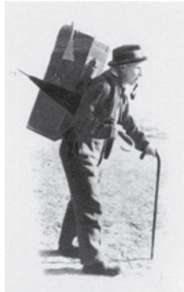
Ein Hausierer aus dem Appenzellerland

Ein Stein des Anstosses für das Gewerbe war gerade in den Zeiten mangelnder Aufträge stets die Regiearbeit der öffentlichen Hand. Im Auge hatte man beispielsweise die in Herisau domizilierte mechanische Werkstätte der kantonalen Bauverwaltung. Im Kantonalvorstand war man der Ansicht, der Betrieb einer solchen Werkstätte könne niemals rentieren und entziehe dem ansässigen Gewerbe lediglich Arbeit, auf