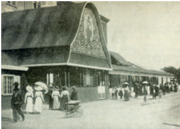
Appenzeller Industrieausstellung in Herisau 1911