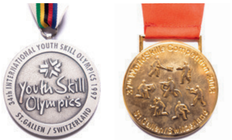
Medaillen der World Skills in St.Gallen, 1997 und 2003