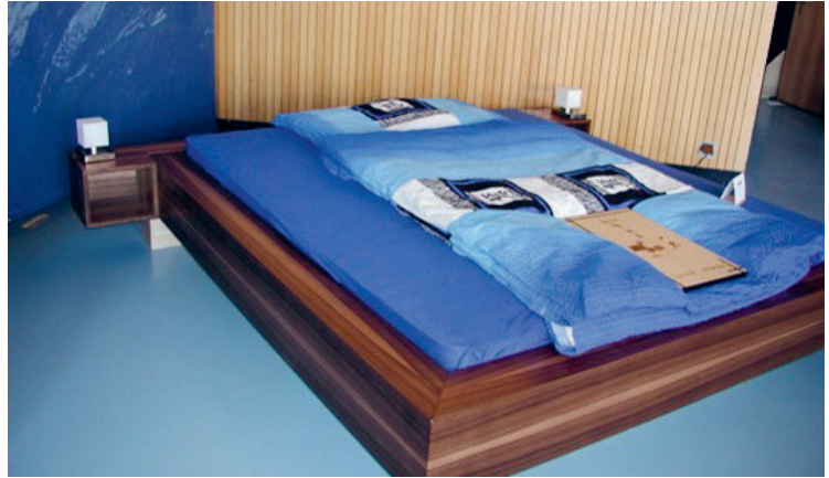
Ausstellungsstücke von verschiedenen Freizeitausstellungen