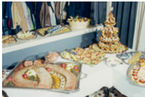
Impressionen vom 75-Jahr-Jubiläum