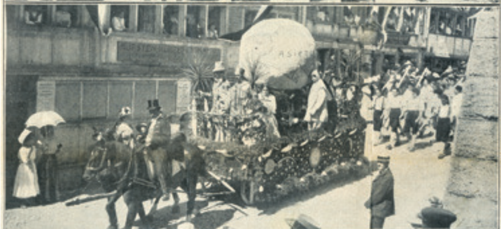
Aus dem Festzug in Herisau, am Eröffnungstag der appenzellischen Gewerbe-, Industrie- und Landwirtschaftsausstellung, 3. Sept. 1911. Der Umzug, der Geselligkeit, Handwerk, Landwirtschaft und Verkehr in prächtig kostümierten Gruppen illustrierte, zählte ca. 1000 Teilnehmer zu Fuß und zu Pferd und 60 Wagen.