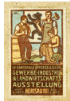
Offizielles Ausstellerplakat 1911