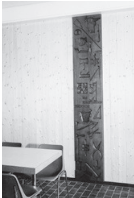
Holzskulptur mit Gewerbesymbolen